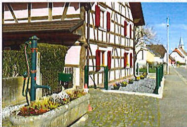
Hagenbach, un village où il fait bon vivre autour de l'église S' Pierre.

D'après les informations du site www.hagenbach.fr