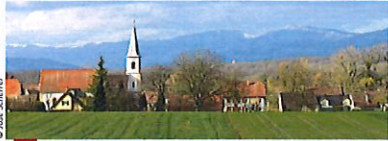
Vue esthétique du village qui se détache devant la ligne bleue des Vosges.