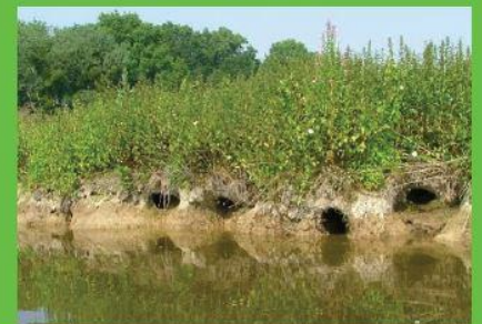
dégâts sur berges