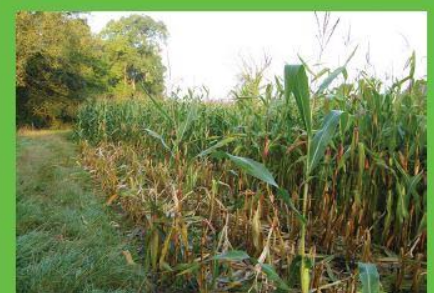
dégâts sur maïs